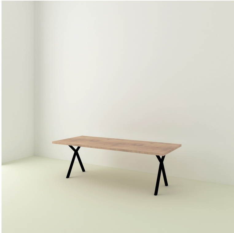
Table Ajaccio pieds Lachaud