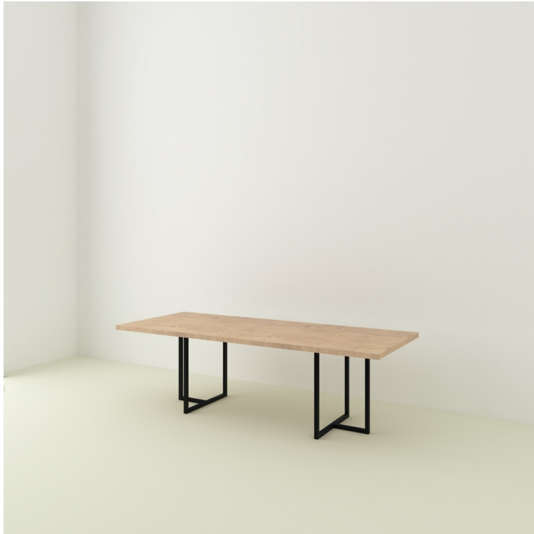
Table Ajaccio pieds T