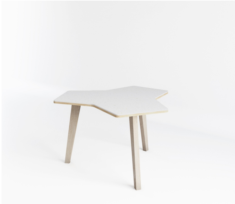
Table Api Trio En Plastique Recyclé