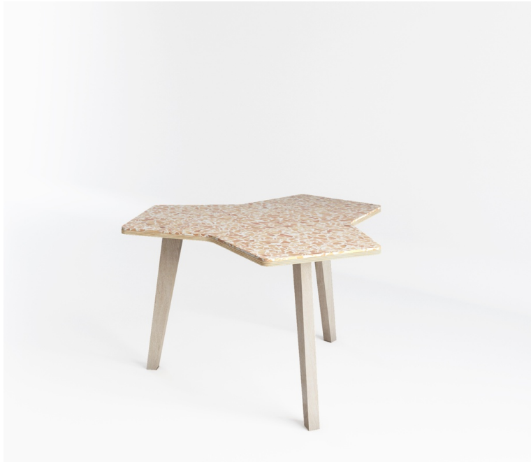
Table Api Trio En Terrazzo De Bois