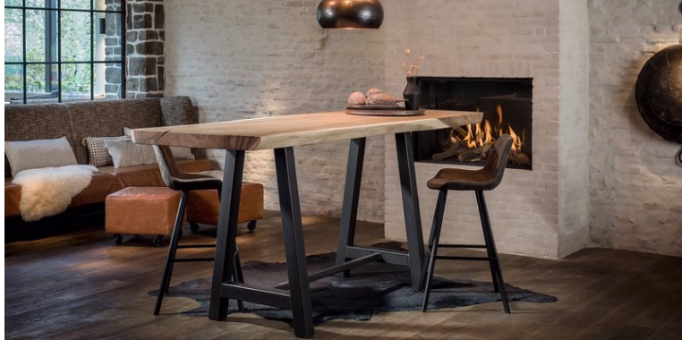
Table Bali Suar