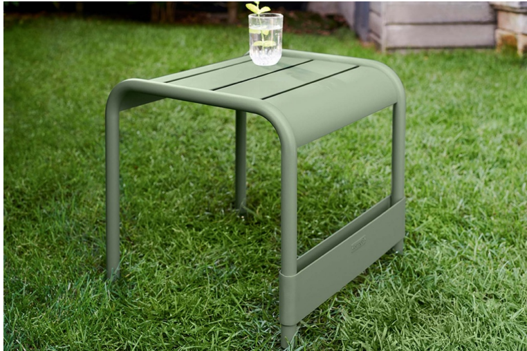
Table basse à roues Luxembourg

La table basse Luxembourg se démarque par sa praticité , parfaite pour un usage en extérieur .