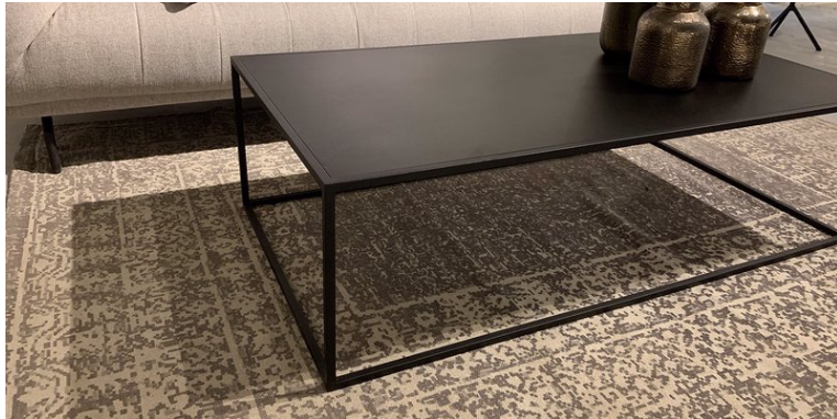
Table Basse Albi