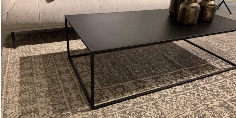
Table Basse Albi