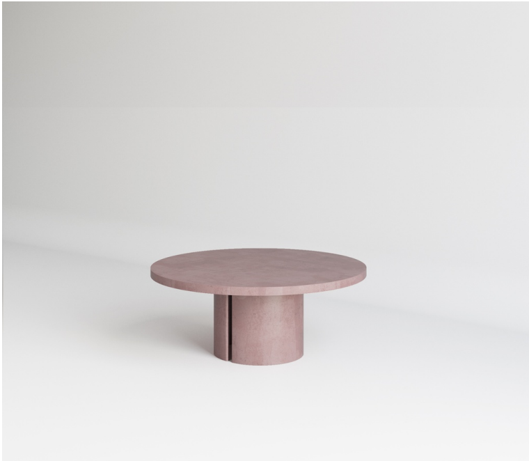
Table Basse Carmen Ronde En Béton pieds Courbe