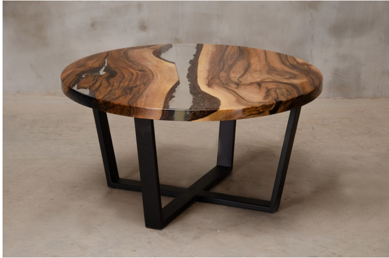
Table Basse Delta En Noyer Massif Et Résine pied W