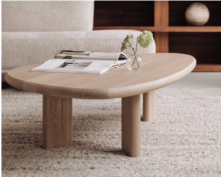
Table Basse Organique En Chêne Massif pieds Bois