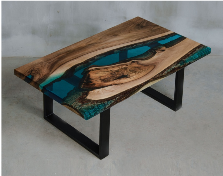
Table Basse Sigma En Noyer Massif Et Résine pieds O