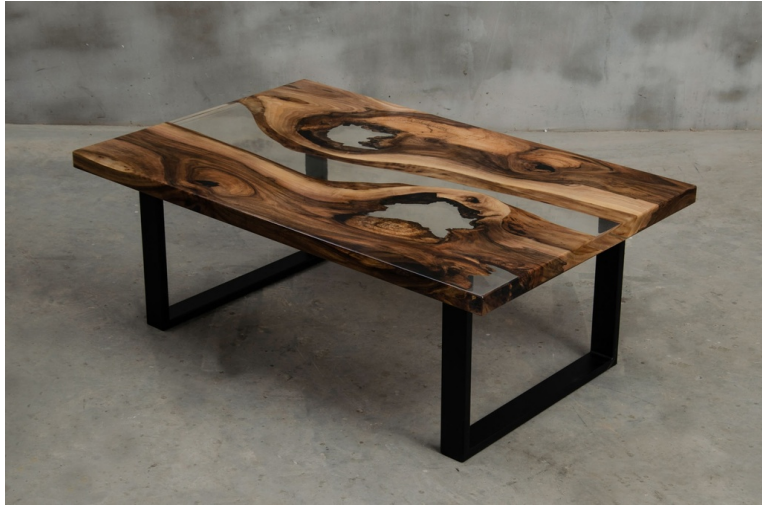
Table Basse Theta En Noyer Massif Et Résine pieds U