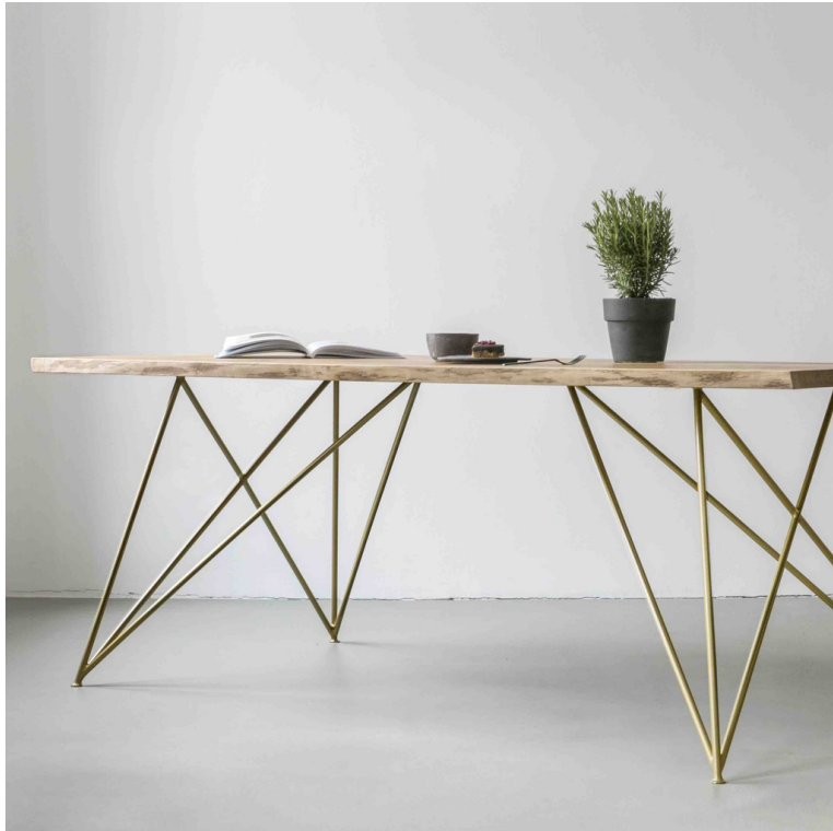
Table Berlin Chêne pieds Laiton