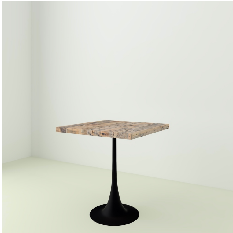
Table Bistrot Plancher De Wagon pieds Tulipe