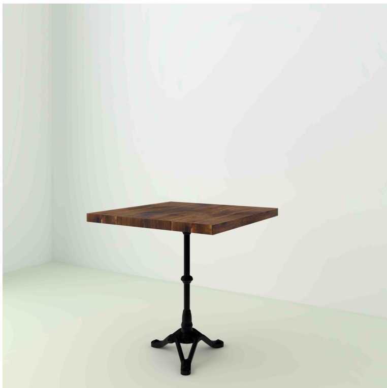
Table Bistrot Sapin Recyclé pieds Classique 3 pieds