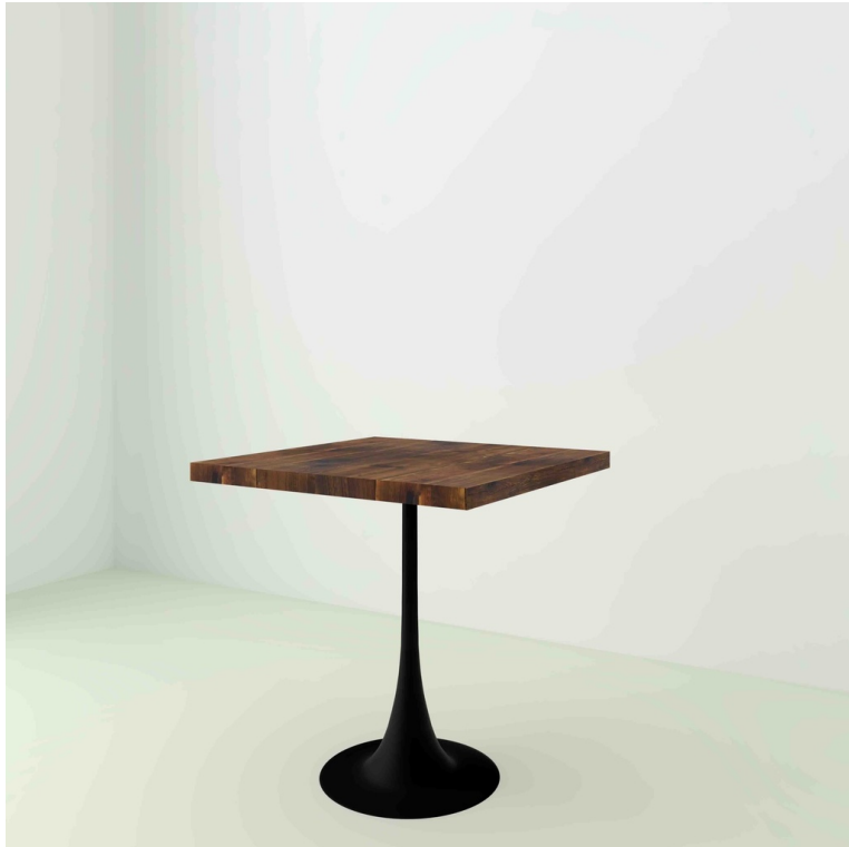
Table Bistrot Sapin Recyclé pieds Tulipe