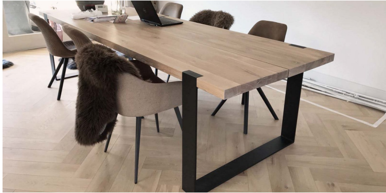
Table Cassis pieds Contemporains