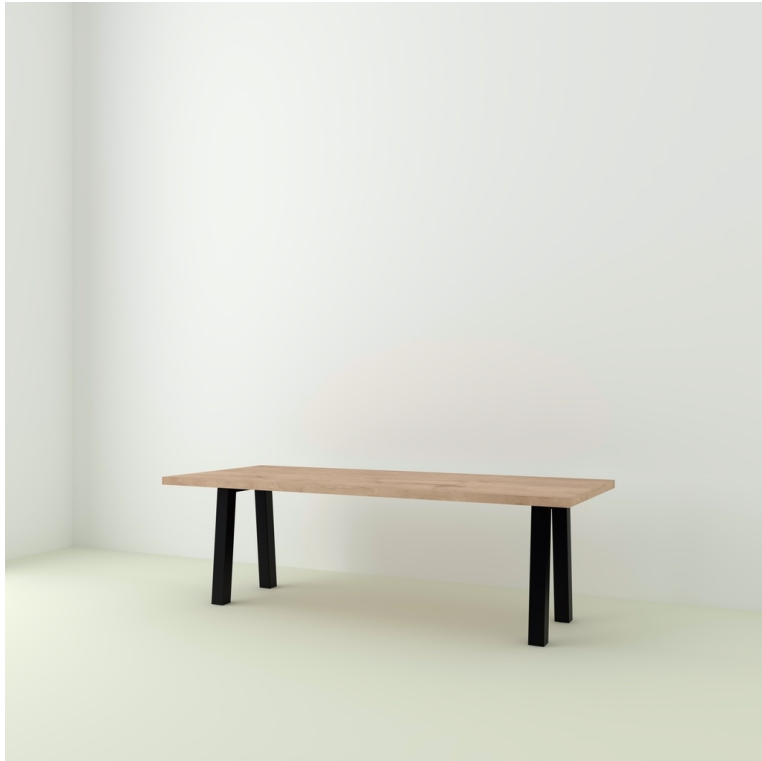
Table Cassis pieds Non Parallèles