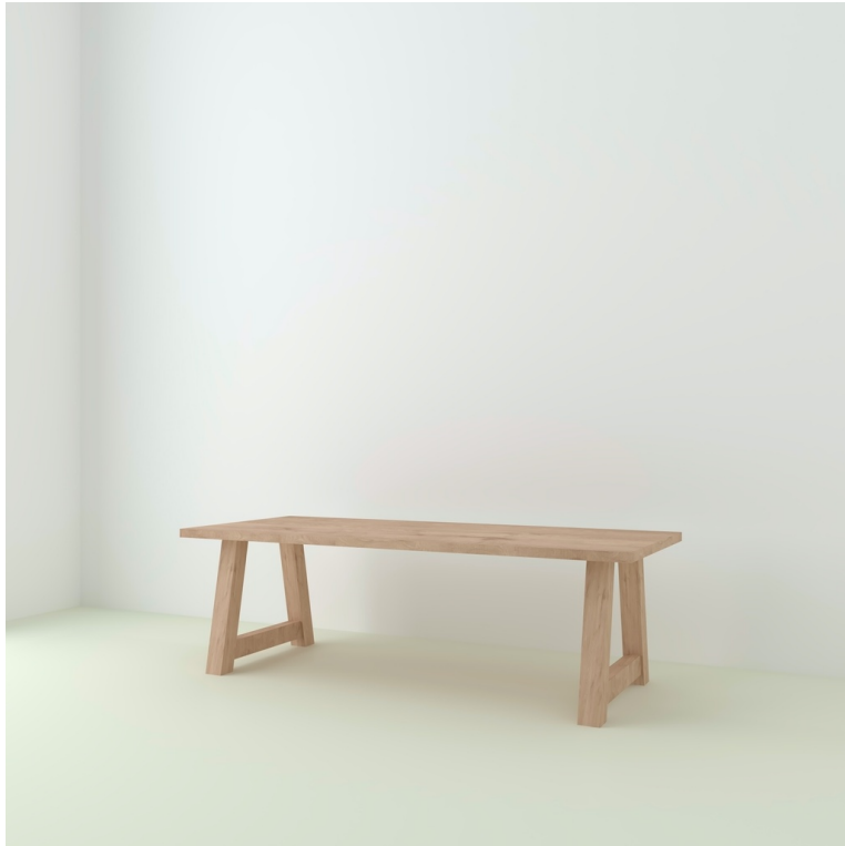
Table Cassis pieds X Bois