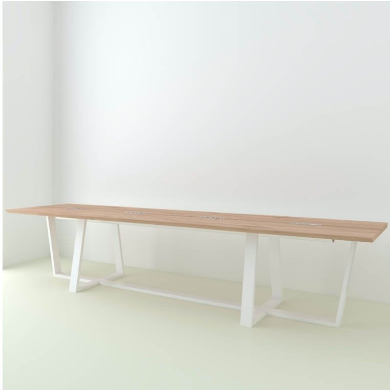
Table César Chêne Live Edge pieds W