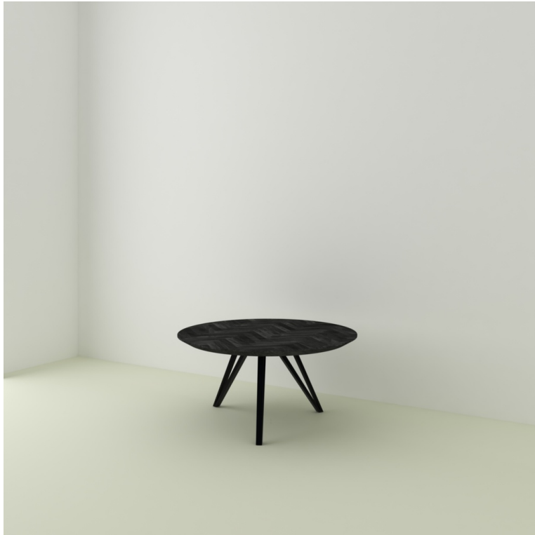
Table Chevrons Namur pieds Chanel