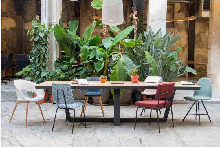
Table Cléopâtre En Chêne Biseauté