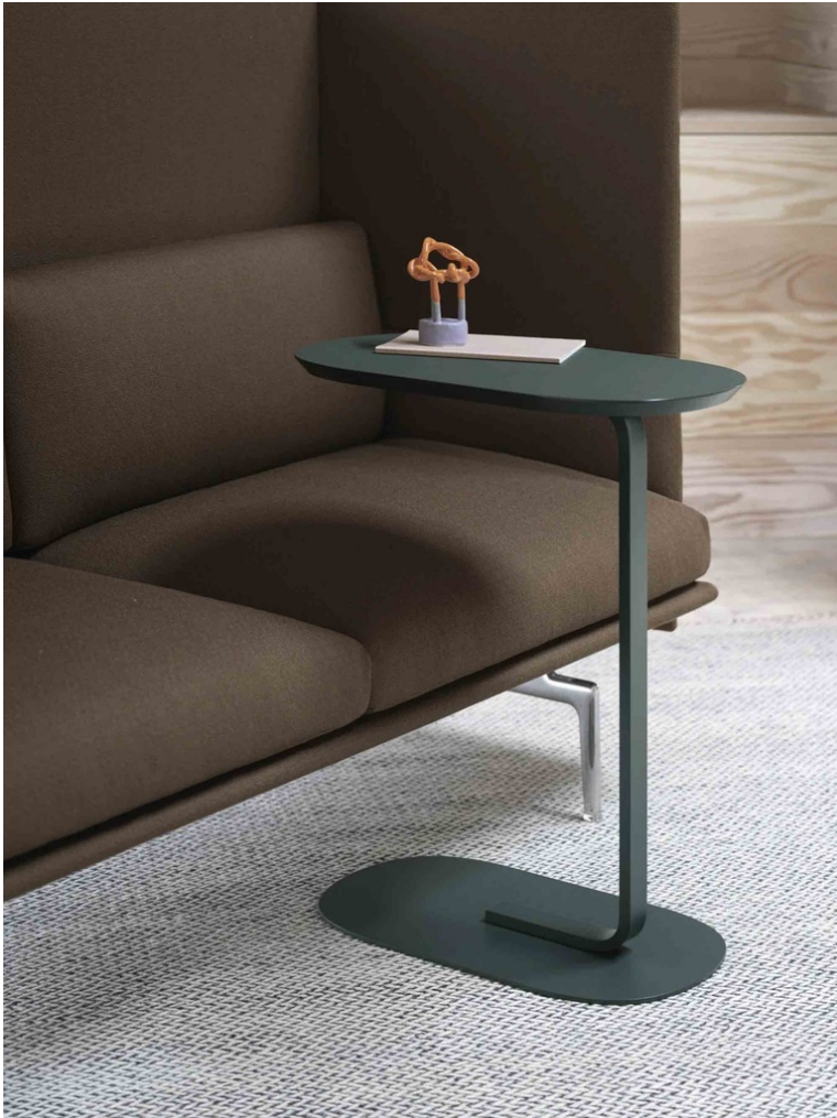
Table d'appoint Relate

Succombez pour la table d'appoint Relate de Muuto à la fois fonctionnelle et esthétique .