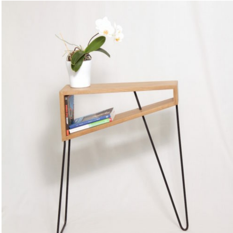
Table De Chevet Detroit