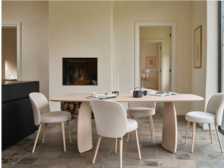
Table Dolmen Ovale