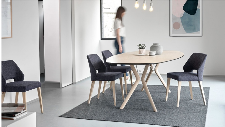
Table ECLIPSE T0100

De forme ronde ou oblongue, la table Eclipse se distingue par sa silhouette en toute légèreté .