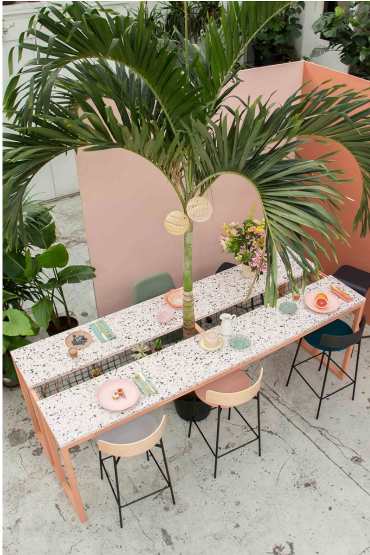
Table Flamingo Convivialité Haute En Terrazzo