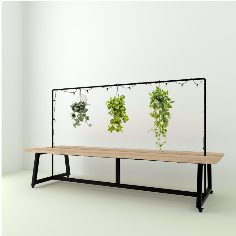
Table Guinguette En Chêne Live Edge