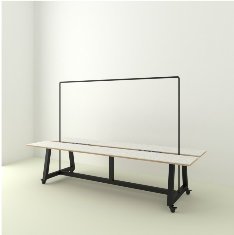
Table Guinguette En Plastique Recyclé