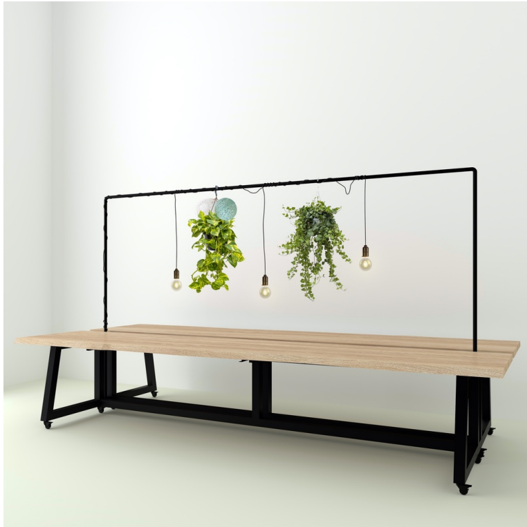
Table Guinguette Modulable En Chêne Live Edge