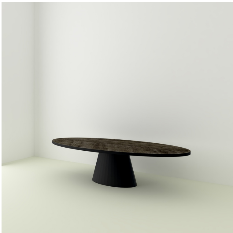
Table Icône Chevrons