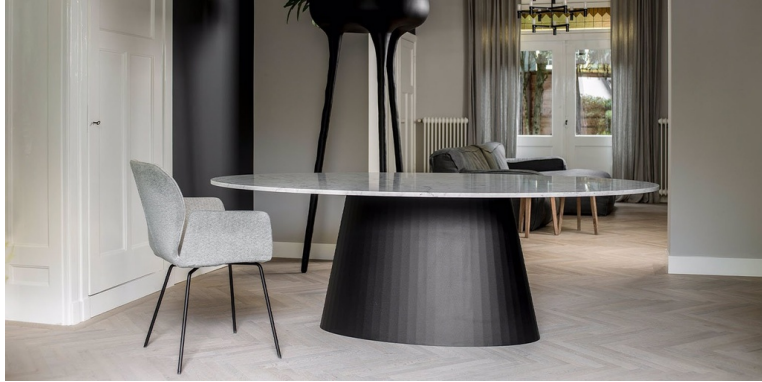
Table Icône Marbre