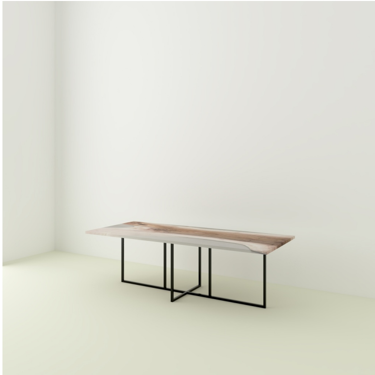
Table Indiana Noyer Et Epoxy pieds Felix