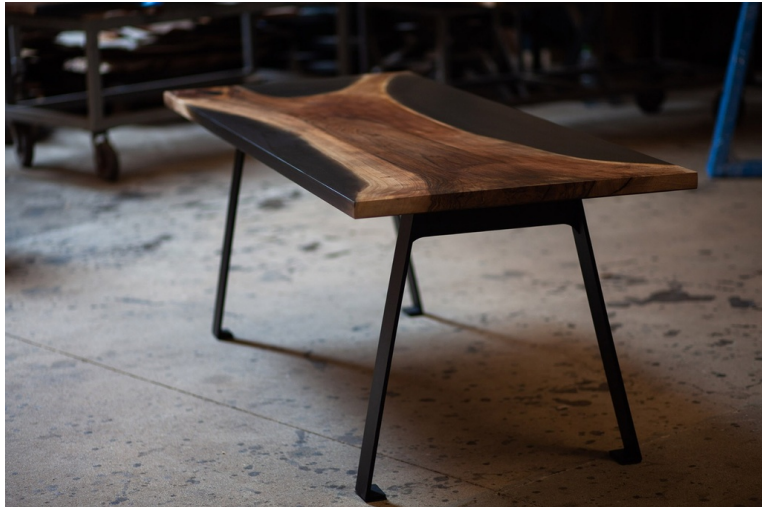
Table Indiana Noyer Et Résine pieds Scandinave A