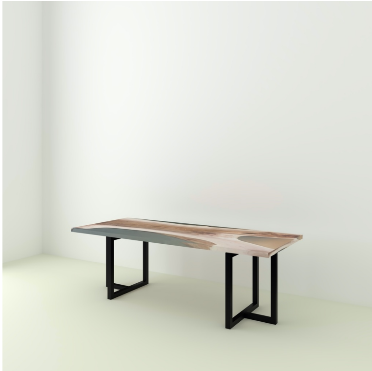
Table Indiana Noyer Et Résine pieds T