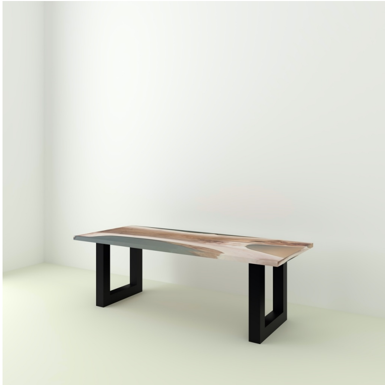
Table Indiana Noyer Et Résine pieds U