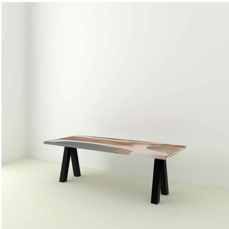
Table Indiana Noyer Et Résine pieds V Inversés