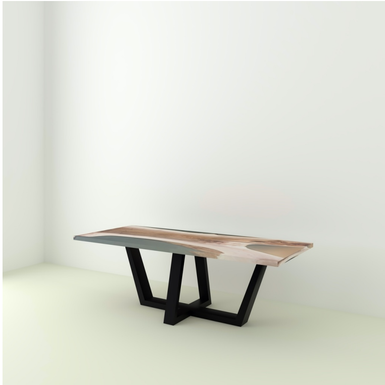
Table Indiana Noyer Et Résine pieds W