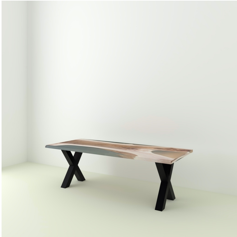
Table Indiana Noyer Et Résine pieds X