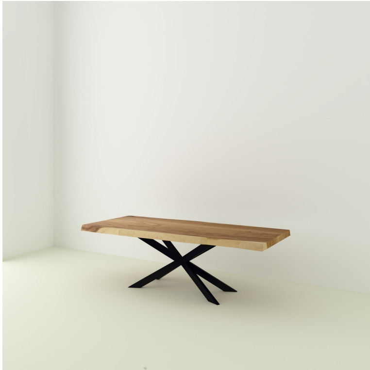
Table Java Suar pieds Croix