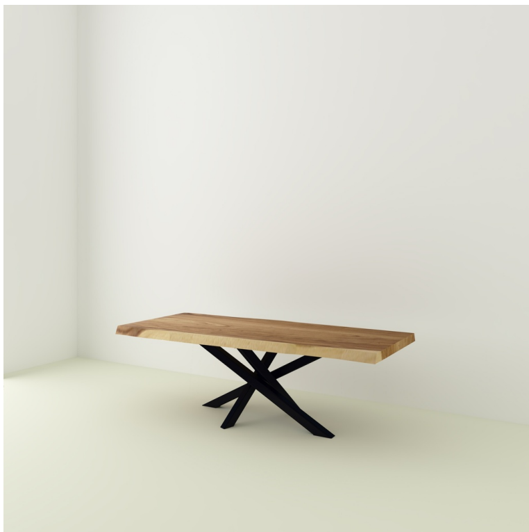
Table Java Suar pieds Mikado