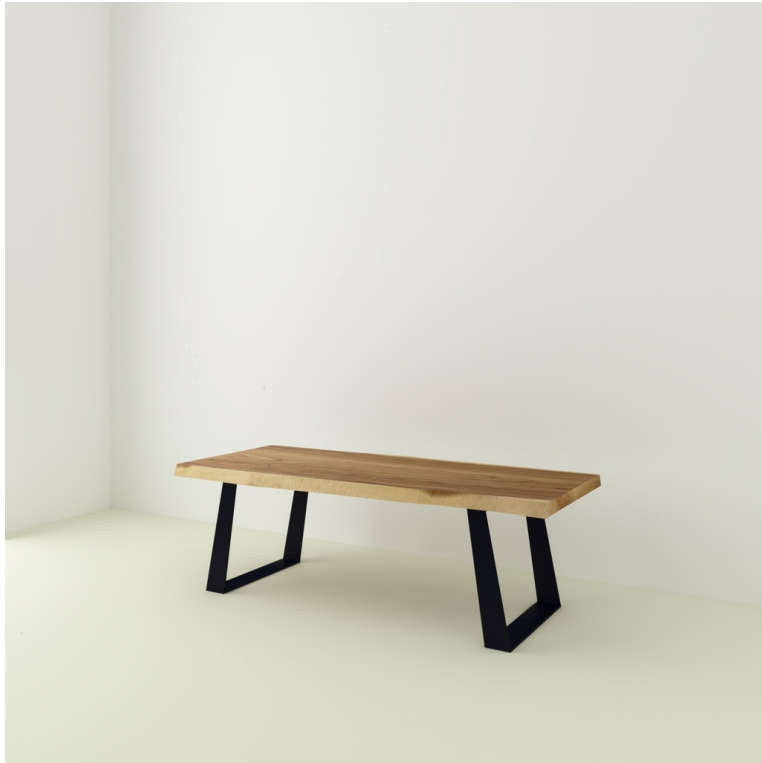
Table Java Suar pieds Penchés