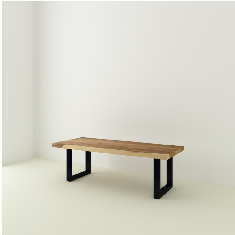
Table Java Suar pieds U