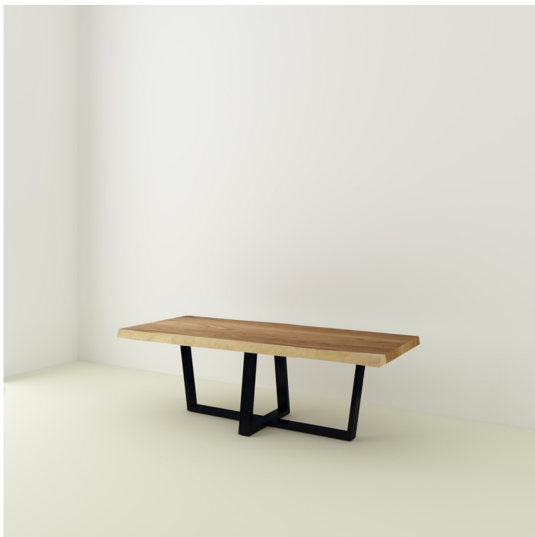
Table Java Suar pieds W