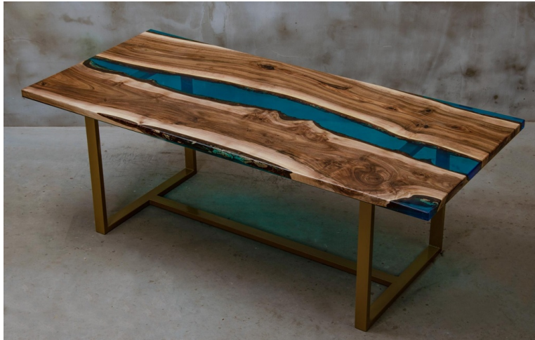
Table Leonis En Noyer Massif Et Résine