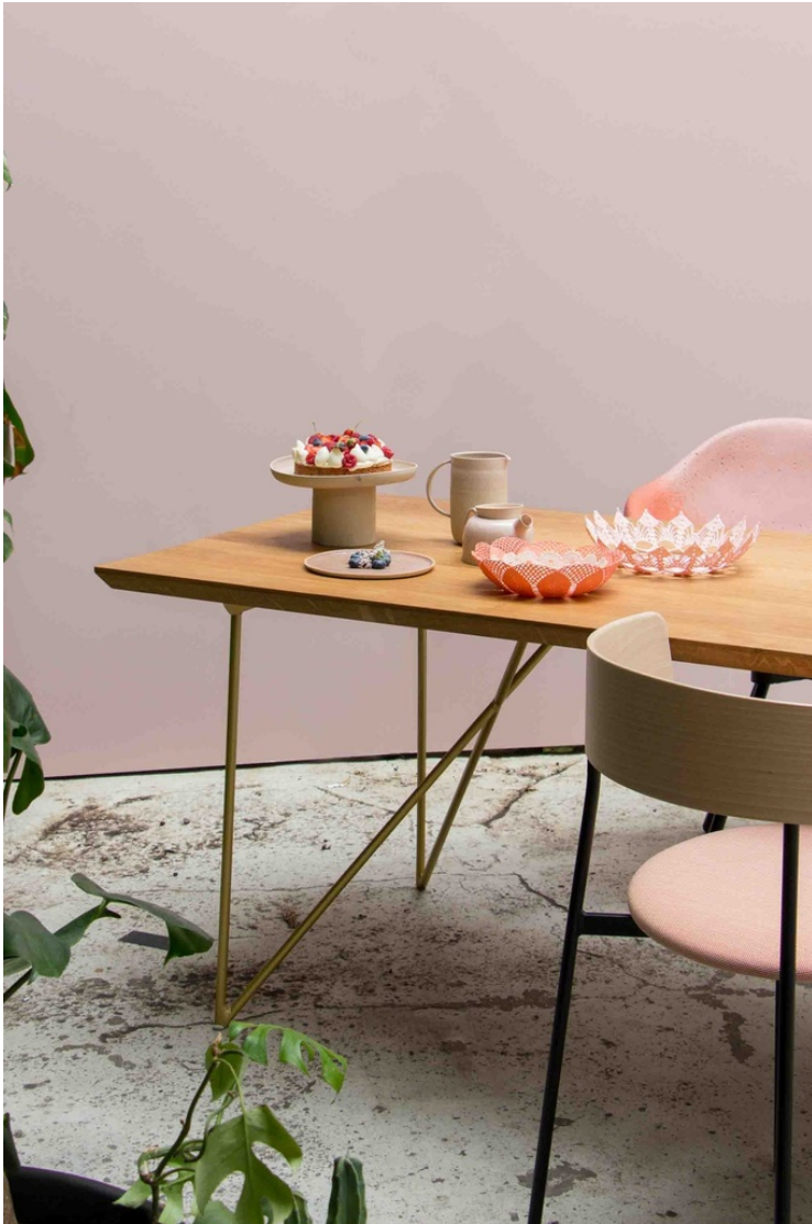
Table Léontine Chêne