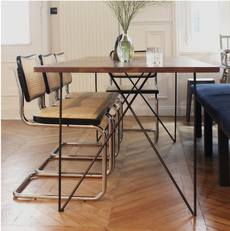
Table Léontine Noyer