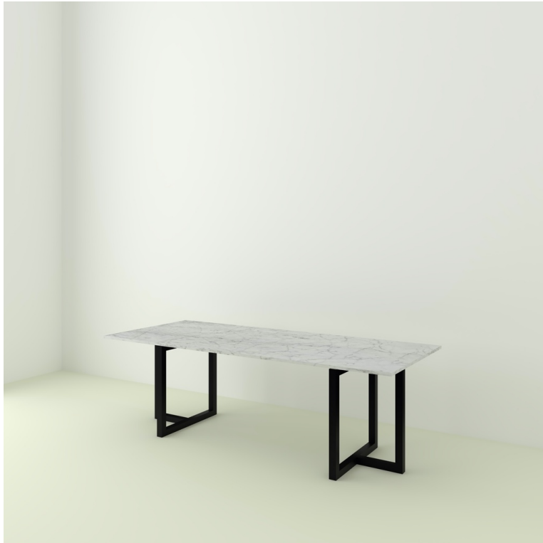
Table Marbre De Carrare pieds T