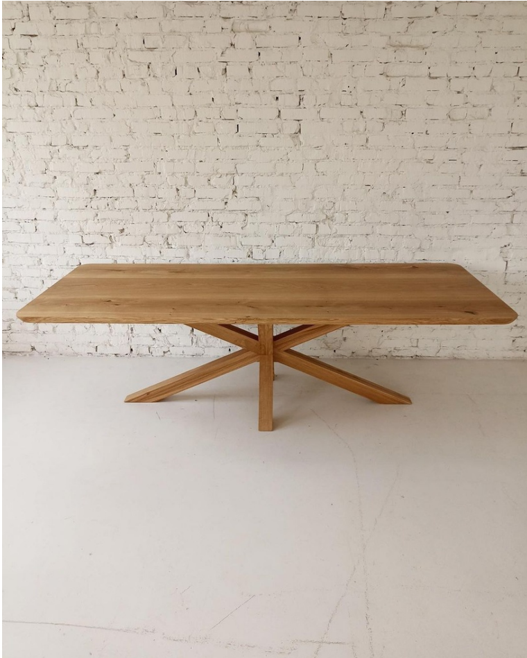
Table Mathilde En Chêne Massif