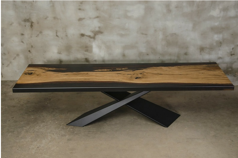
Table Monolith En Résine